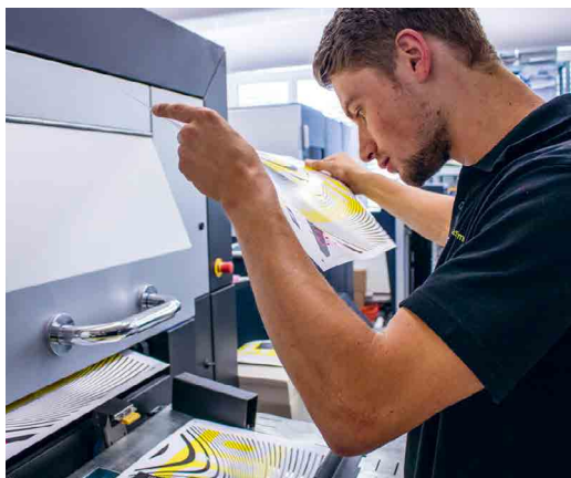
12 000 werden die Bogen auf der Scodix S75 digital mit Reliefflack veredelt.