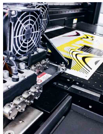
Nach dem Druck auf der HP Indigo